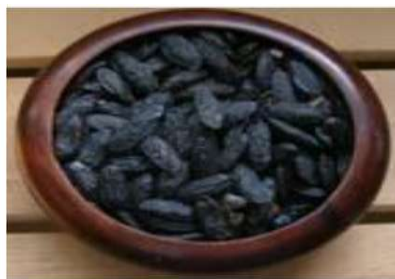
Slika 1. Drvo Coumarouna odorata Aube ( Dipetryx odorata ) i njegov plod Figure 1. Wood Coumarouna odorata Aube ( Dipetryx odorata ) and its fruit