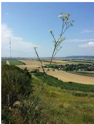
Slika 1. Seseli pallasii Besser

Uspeva na suvim, kamenitim pašnjacima i livadama, peskovitim nanosima, u šikarama, pored puteva, na nasipima. Uglavnom se javlja u delovima istočne i jugoistočne Srbije, dok je u ostalim delovima zemlje manje zastupljena. Najčešći narodni naziv je devesilje i neretko se koristi u narodnoj medicini.