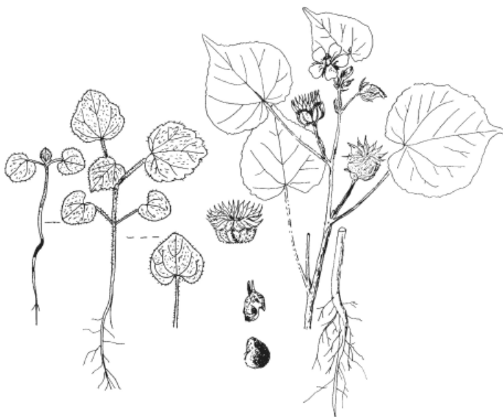
Slika 1. Ponik (levo) i odrasla biljka (desno) A. theophrasti (Vrbničanin i Šinžar, 2003)

A. theophrasti je jednogodišnja širokolisna biljka (terofit, T_4 ) koja se razmnožava i prezimljava (preživljava) u obliku semena (Warwick and Black, 1988). U početnoj fazi rasta, 1-2 dana posle nicanja, prvo se razvija glavni koren nakon čega se intenzivno formiraju lateralni korenčići (Warwick and Black, 1988). Ponik A. theophrasti (Slika 1, crtež levo) ima okruglaste kotiledone listiće sa srcastom osnovom, dimenzija 10-15 x 8-15 mm sa mestimično dlakavim drškama dužine do 10 mm. Prvi pravi list ponika je okruglo-jajolik sa srcastom osnovom, dlakav i po obodu sitno testerast. Hipokotil je debeo, zelenkast i slabo dlakav.