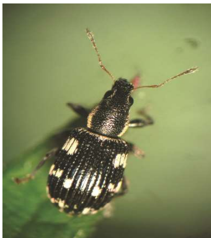
Slika 1. Imago P.(P.) picus ssp. picus

grupisanim zelenkasto-beličastim duguljastim ljuspicama, a na pokriocima su takve ljuspice grupisane tako da formiraju po desetak nepravilnih pega (Slika 1).