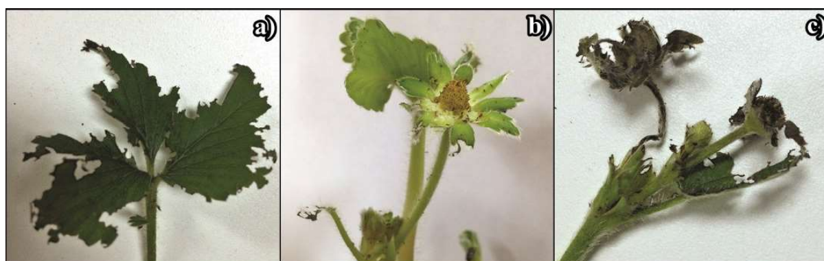
Slika 3. a) Oštećenja na listu jagode; b) Izgrizeni čašični listići oko cvetnog pupoljka jagode; c) Izgrizeni i osušeni nadzemni delovi jagode