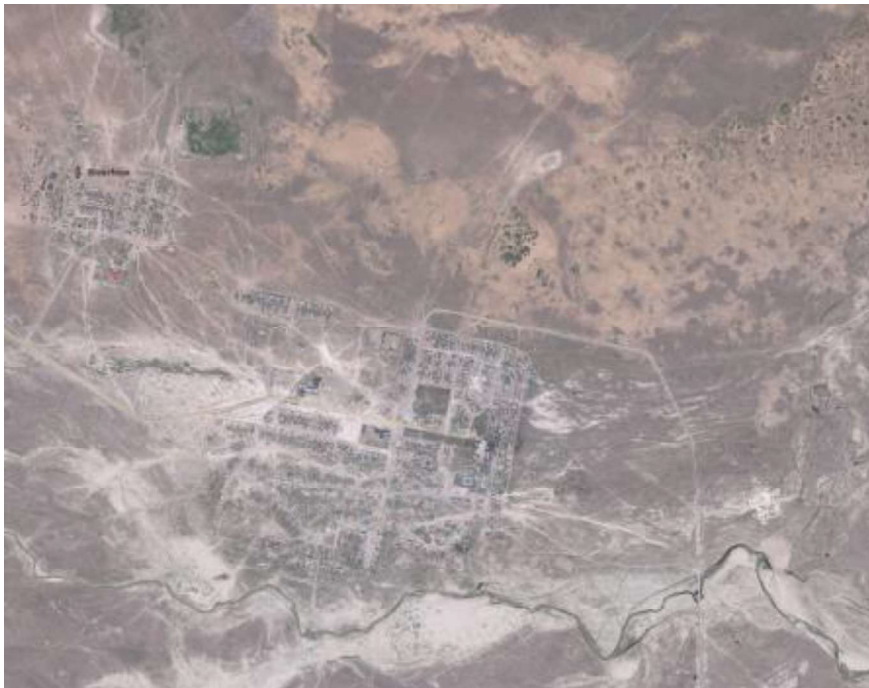
Slika 1. Satelitski snimak analiziranog reiona Karatobe, Zapadno Kazahstanske oblasti Figure 1. Satellite image of the analyzed regions Karatobe, Western Kazakhstan area

U radu je načinjena kosmokarta pomenutog poligona uz pomoć programa GlobalMapper . Koordinate poligona su 49^{\circ}41'02'' severne geografske širine i 53^{\circ}32'33'' istočne geografske dužine (Sl. 1).