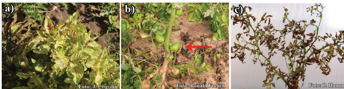
Sl. 1. Simptomi ZČ na nadzemnim organima biljaka krompira: a) hloroza, uvi- jenost i ljubičasta obojenost lišća; b) razvoj vazdušnih krtola iz bočnih pupoljaka, c) ožegotine i izumiranje biljaka