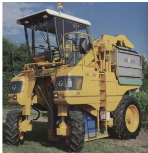
Sl. 3. Višenamenska mašina za vinogradarsku proizvodnju

S obzirom da je berba grožđa mehanizovanim načinom relativno novijeg datuma sa njom se u našoj zemlji nema dovoljno iskustva. Njeni rezultati zavise od niza faktora tehničke i biološke prirode koji su uzajamno vezani i uslovljeni. Pored konstruktivnih rešenja same mašine, od velikog su značaja konfiguracija i nagib terena, raspored i broj čokota, visina i sistem gajenja,