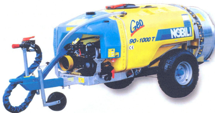
Sl. 1. Vučeni traktorski orošivač Fig. 1. Air assisted sprayer pulled