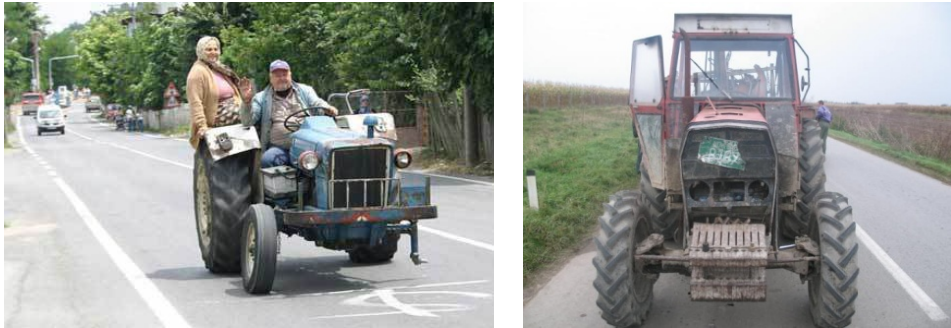
Slika 3. Neispravni traktori u javnom saobraćaju Srbije

To je pre svega rezultat: psihofizičkih faktora, upotrebe alkohola, nepažnje, nestručnog rukovanja, neispravnosti mašina (Sl. 3.), nedovoljnog obrazovanja i nediscipline, nepoznavanja saobraćajno-tehničkih propisa i slično.