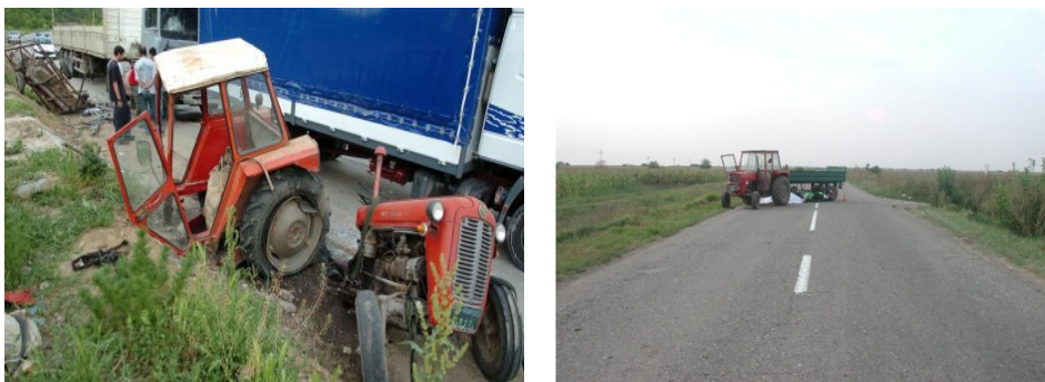
Slika 1. Nesreće sa traktorima, i tragične posledice

Oljača et al., [12] navode da je u saobraćajnim nezgodama i nesrećama sa traktorima, u periodu 1999. godine do 2009. godine u javnom saobraćaju Republike Srbije, u proseku godišnje, poginulo 62 vozača traktora ili učesnika, dok je 144 teško povređeno. Utvrđeno je da su: nepažnja i nedovoljna obučenosť vozača i tehnička neispravnost i zastarelost traktora, veoma često najčešći uzroci saobraćajnih nezgoda koje se događaju sa traktorima (Sl. 1.).