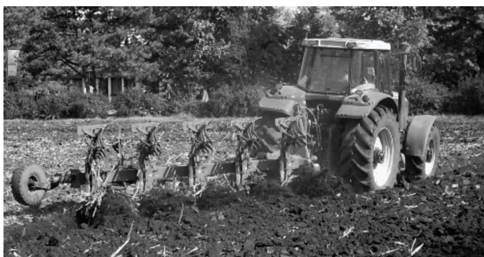
Sl.1. Traktor Massey-Ferguson 8160 u radni operacijama na poljima PKB-a