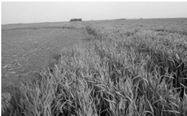
Sl.1. Izgled parcele a) levo nemeliorisana površina b) desno meliorativna obrada

raoničnim plugom obrtačem 18.10 2008. godine na dubinu 30-35 cm i adekvatna predsetvena obrada - (CT - Konvencionalni sistem obrade zemljišta). Na parcelama su posejani kukuruz i suncokret kao ogledni usevi u prvoj ispitivanoj godini. U jesen 2009. godine izvedena je osnovna obrada raoničnim plugom na predusevu kukuruzu i suncokretu i posejana je ozima pšenica sorta "Dragana " Novosadskog Instituta za ratarstvo i povrtarstvo.