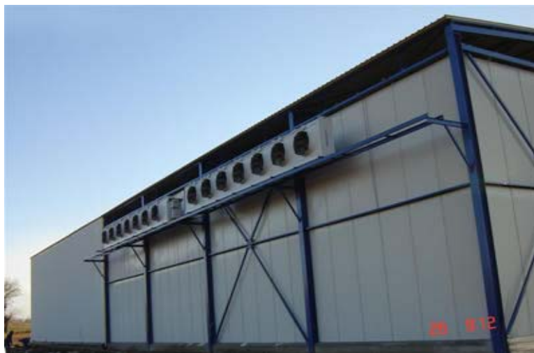
Slika 1. Spoljašnji izgled ULO hladnjače

Prikaz hladnjače spolja dat je na slici 1.