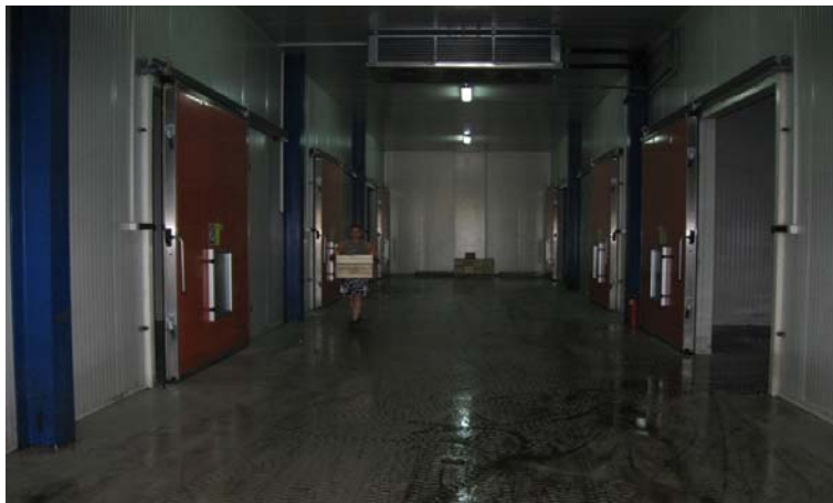
Slika 2. Unutrašnjost ULO hladnjače

ULO komora koje su bočno raspoređene u odnosu na hodnik. Prikaz unutrašnjosti hladnjače, odnosno rasporeda komora u ULO i plusnom režimu dat je na slici 2.