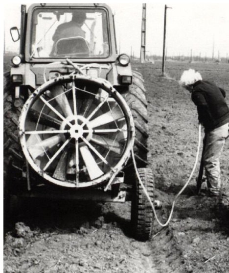
Sl. 4. Hidrobura u radu

Hidrobura je sličan pumpi za pneumatike sa mlaznicom na vrhu koja obično ima četiri rupe; jedna u sredini prečnika 3 mm i tri oko nje koje imaju prečnik 1,5 mm. Uz radni pritisak do 40 bar ovaj alat potiskuje vodu u količini od 60 l/min. Uslovi zemljišta i dimenzije rupa određuju ukupan utrošak vode, a obično se kreće 5 do 8 l/rupi. Za rad ovog alata se u praksi često koriste pumpe koje se nalaze u sastavu orošivača tako da se voda uzima iz njegovog rezervoara (slika 4).