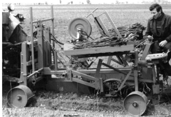
SI 5. Poluautomatska sadilica