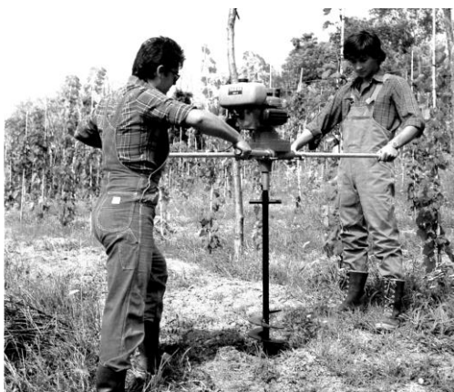
Sl. 2. Ručno navođena bušilica rupa sa motornim pogonom