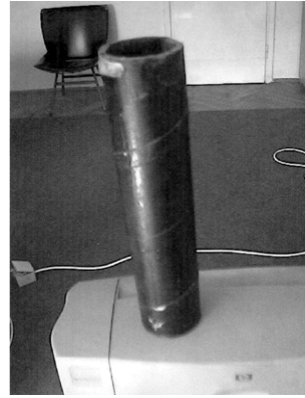
Слика 2. Патрона