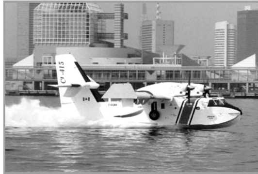
Слика 3. Авион типа Канадер

Један од првих типова авиона који је произведен за гашење шумских пожара је авион типа "Канадер" CL-215 (слика 3), искључиво намењен за бомбардовање пожара, тј. избацивање целе количине воде на једно место.