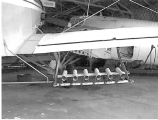
Слика 1. Модификација авиона