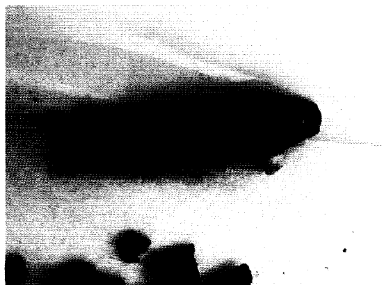
Sl. 3. Izgled uginulog puža nakon trovanja gvožđe pirofosfatom hidrata (Arion)

Preparat Arion je akutni moluscid novije generacije, na bazi aktivne materije feri pirofosfat hidrata (so gvožđa) koji deluje kao otrov preko digestivnog trakta (Henderson i sar., 1989; Young, 1996). Ekološki je povoljan jer se razgrađuje do Fe i fosfata, analoga prirodnih produkata i konstituenata biljaka, zemljišnih mikroorganizama i životinja. Puževi ubrzo po unošenju preparata prestaju da uzimaju hranu, dolazi do njihovog sušenja i uginjavanja u bočnom položaju. Za razliku od drugih jedinjenja (limacida), uginjavanje puževa je produženo zavisno od količine unosa preparata i uslova sredine,