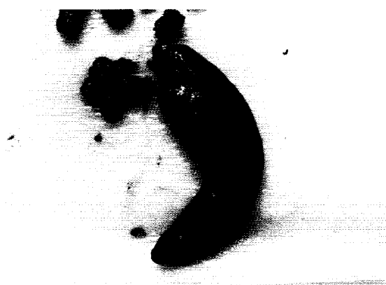
Sl. 2. Izgled uginulog puža nakon trovanja metaldehidom (Gardene)

Preparat Gardene (aktivna materija metaldehid), ispoljava efekte delovanjem acetaldehida, koji nastaje pri niskim pH-vrednostima u želucu. Acetaldehid deluje kao faktor koji oslobađa 5-hidroksitriptamin (5-HT) i noradrenalin, povećava aktivnost monoamin oksidaza i smanjuje nivo serotonina u centralnom nervnom sistemu. Deluje dobro i kontaktno i digestivno, izaziva obilnu sluz i dehidraciju puževa golaća, koji uginu na boku, tipično naviše savijenog kaudalnog dela sto-