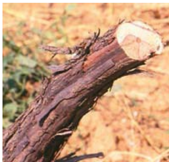
Sl. 10. „V” nekroza sa linijom razgraničenja zahvata približno polovinu površine poprečnog preseka obolelog čokota Fig. 10. „V” necrosis with demarcation line taking approximately half of the area of cross section of a diseased grapevine