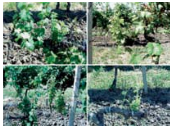
Sl. 2. Različita izraženost simptoma eutipoze - srednje do veoma vidljivo skraćenje internodija lastara sa svetlozelenim lišćem neujednačenih veličina; cvasti i grozdovi se ne obrazuju

Fig. 1. Disease symptoms in the innitial phase; smaller leaves and mildly decreased nodes of herbage shoots