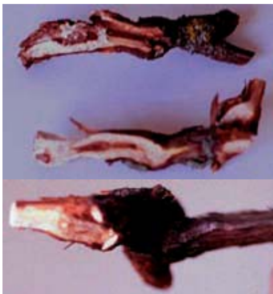
Sl. 8. Promene središnjeg dela stabla vinove loze u vidu tvorevina tumora i nekroza oko starih preseka od rezidbe (gore i dole) Fig. 8. Changes in the middle part of a grapevine tree in the form of tumoral formation and necrosis around the older sections in the cutting (up and down)