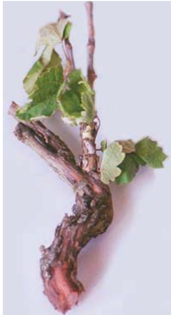
Sl. 6. Sitno, uvijeno lišće i skraćeni lastari na obolelom kraku Fig. 6. Small, twisted leaves and shortened shoots on a diseased branch

Na uzdužnom preseku obolelih delova drveta, oko starih preseka od rezidbe, zapažaju se tvorevine tumora, koje se prostiru duž stabla u pojasevima, prvo na površini, a zatim prodiru i u unutrašnjost (Slika 8).