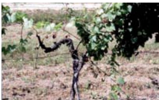
Fig. 3. Extremely strong intensity of disease with extremely shortened chlorotic shoots, without leaves or with very small leaves and complete absence of blossoms and clusters (a and b)

Sl. 4. Izumrli zaraženi čokot vinove loze i zdravi lastari susednog (desno) čokota u redu