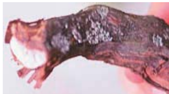
Sl. 7. „V” nekroze u srednjem stadijumu razvoja, koje zahvataju približno polovinu površine poprečnog preseka stabla i krakova; na spoljnoj strani drveta, duž nekroze, vidi se veća pukotina Fig. 7. „V” necrosis in the middle development stage taking approximately one half of the area of tree and branches cross section; on the external side of the tree, along the necrosis, a larger crack is noticeable