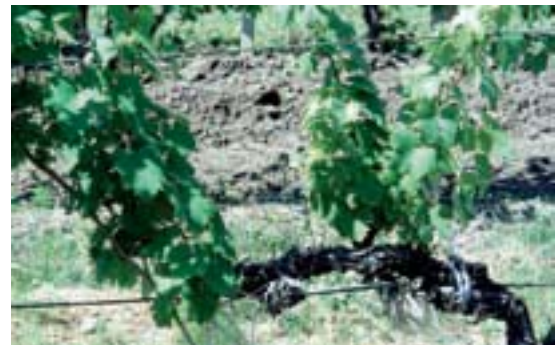
Sl. 1. Simptomi bolesti u početnoj fazi; sitnije lišće i blago skraćeni članci zeljastih lastara

U nekim delovima vinograda uočavaju se grupe čokota ili tzv. „žarišta” od dva, tri i više obolelih čokota. Ta žarišta su, takođe, potpuno slučajno raspoređena u celom vinogradu. Lišće je potpuno hlorotično sa sitnim i peharasto uvijenim liskama. Lastari su jako skraćeni internodija, sa potpunim odsustvom cvasti. Često rastu iz jednog mesta na kraku i imaju tzv. „cikcak” izgled (Slika 2).