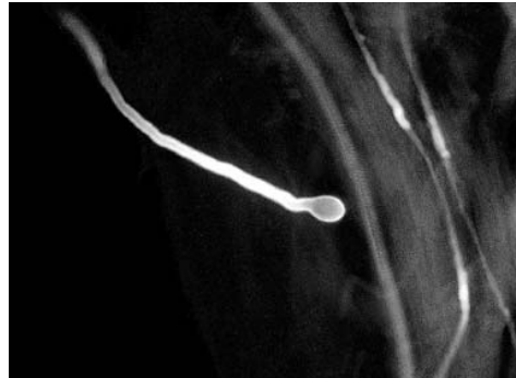
Sl. 4. Inkompatibilna polenova cevčica sa proširenim vrhom, sorta Szegedi mamut (uvećanje 200x)

Fig. 3. Incompatible pollen tubes with plugs at the tips, cv Ceglédi Óriás (enlargement 100x)