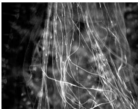
Sl. 1. Osnova stubića sa većim brojem polenovih cevčica, sorta Čačansko zlato (uvećanje 100x)

Sorte su smatrane samooplodnim ako je kod većine tučkova bar jedna polenova cevčica stigla do plodnika. Od 25 proučavanih sorti kajsije 16 je bilo autokompatibilnih i to: Rana iz Tirinta, Ambrozija, Vera, Čačanska pljosnata, San Kastreze, Čačansko zlato, Kečkemetska ruža, Kalatis, Crveni partizan, Cegledi bibor, Mamaja, Roksana, Silistrenska kompotna, Biljana, Beržeron i Mađarska najbolja. Kod ovih sorti skoro kod svih tučkova (95 - 100%) polenove cevčice su stizale do plodnika (Tab. 1, Sl. 1 i 2). Broj polenovih cevčica u osnovi stubića kod njih se kretao od 6,1 (sorta Kalatis) do 14,5 (Cegledi bibor). Broj polenovih cevčica koje su uočene u plodniku varirao je od 1,6 (sorte Mađarska najbolja i Kečkemetska ruža) do 5,7 (San kastreze). Procenat tučkova kod kojih je bar jedna polenova cevčica ušla u semeni zamac kretao se od 33,3% (Cegledi bibor) do 94,1% (Rana iz Tirinta).