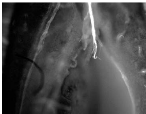
Sl. 2. Prodor polenove cevčice u ovulu, sorta Mađarska najbolja (uvećanje 100x)

Fig. 1. The base of the pistil with higher number of pollen tubes, cv Cacak's Gold (enlargement 100x)