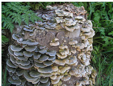
Slika 1. Ćuranov rep Picture 1. Turkey tail

Izolovan je polisaharid koriolan koji u sebi ne sadrži azot sa dokazano izraženim antitumorskim i antibakterijskim dejstvom. Ukoliko su neke bakterije rezistentne na antibiotike tokom dugotrajnog lečenja, ovaj polisaharid uklanja rezistenciju. Ćuranov rep deluje kao vazodilatator, dokazan je pozitivan uticaj na dijabetes, tromboze, reumatizam, povišen sadržaj masnoća u krvi, upalne procese, formiranje i razgradnju prostanglandina i druge procese.