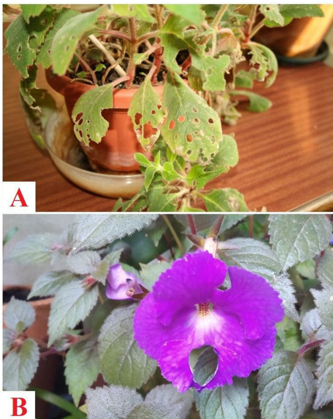
Slika 8. Oštećenja na listovima (A) i cvetu (B) kohlerije (orig.)