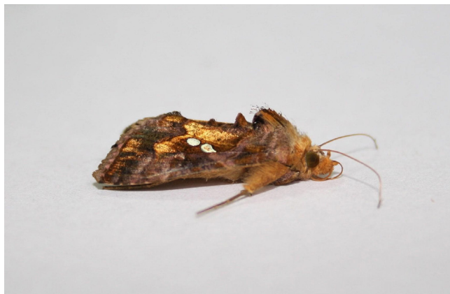
Slika 1. C. chalcites - imago (orig.)

nalaze se dva vrlo uočljiva čuperka izduženih ljuspica (Slika 1). U miru krila drže krovoliko. Mužjak na kraju trbuha ima dva čuperka crnih dlačica, koji kod ženke odsustvuju (Slika 2).