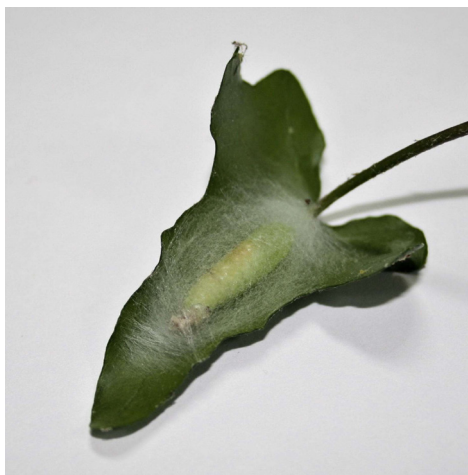
Slika 4. C. chalcites – lutka (orig.)