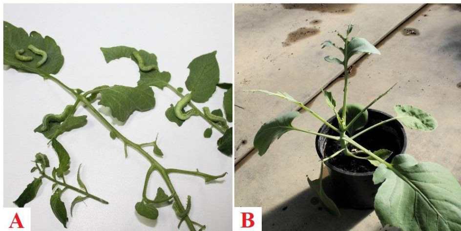
Slika 7. Golobrst na paradajzu (A) i kupusu (B) (orig.)