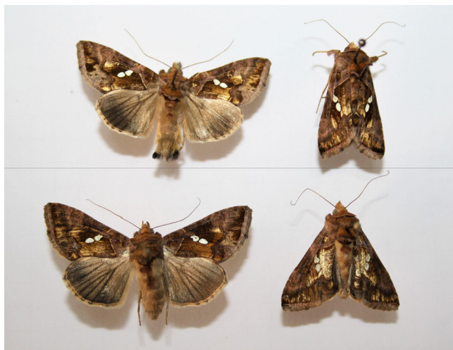
Slika 2. C. chalcites - mužjak (gore) i ženka (dole) (orig.)

Gusenica je svetlozelene boje sa uzdužnom svetlom prugom bočno na telu i sa tri para trbušnih nogu (Sl. 3). Lutka se nalazi u rastresitom, svilastom kokonu sa naličja lista ili na drugim skrovitim mestima (Sl. 4). Lutka je u početku svetlozelene boje, a kasnije dorzalna strana poprima smeđu boju.