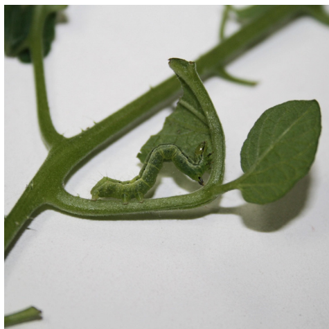
Slika 3. C. chalcites – larva (orig.)