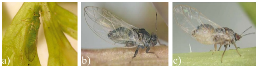
Sl. 3. ' Candidatus Liberibacter solanacearum ' – imaga vektora prenosioca: a) Trioxa apicalis – odrasla jedinka; b) Bactericera trigonica – odrasla jedinka, i c) Bactericera trigonica – odrasla jedinka

' Ca. L. solanacearum ' u prirodi se prenosi vektorima. Oboljenja koje ova fitopatogena bakterije prouzrokuje na biljkama domaćinima nastaju kao posledica složene interakcije biljke domaćina, insekta vektora i patogena (Munyanza, 2012; Obradović i sar., 2014). Prisustvo patogena utvrđeno je u provodnom tkivu floema zaraženih bljaka i pljuvačnim žlezdama insekata vektora, ali i u asimptomatičnim biljkama, koje mogu predstavljati izvor inokuluma za osetljivije biljke domaćine (Levy i sar., 2011; Lin et al., 2013; Nissinen i sar., 2014). Glavnu ulogu u epidemiologiji bolesti u Severnoj Evropi ima mrkvina lisna buva Trioxa apicalis Förster (Hemiptera: Triozidae), dok se Bactericera trigonica Hodkinson (Hemiptera: Triozidae) navodi kao potencijalni vektor oboljenja u Španiji i na Kanarskim ostrvima (Munyanza, 2010d; Alfaro-Fernandez i sar., 2012a,b; Teresani i sar., 2014) (Sl. 3).