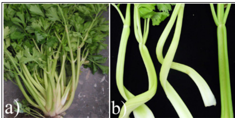
Sl. 2. ' Candidatus Liberibacter solanacearum ' – simptomi na nadzemnim i podzemnim organima biljaka celera: a) proliferacije izdanka, i b) uvijanja stabla