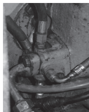
Sl. 2. Razvodnik na RPP Fig. 2. Distributor on DPD