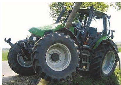
Sl. 1. Nesreće sa traktorom u javnom saobraćaju