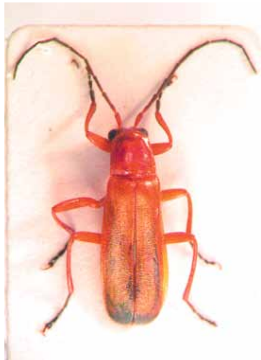
Slika 15. Rhagonycha fulva (Scopoli)

Vrsta je u Vašingtonu (SAD) gajena i korišćena u biološkoj kontroli C. pyri , ali bez zadovoljavajućih rezultata (Fye, 1981, cit. Herard, 1986).