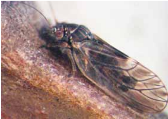
Slika 1. Imago Cacopsylla pyri (L.)

Nakon izletanja, parazitoidi su preparovani standardnim entomološkim metodama, a zatim determinisani. Imaga predatora su sakupljana direktno iz kolonija lisne buve ručnim ekshaustorom, dok su larve saku-