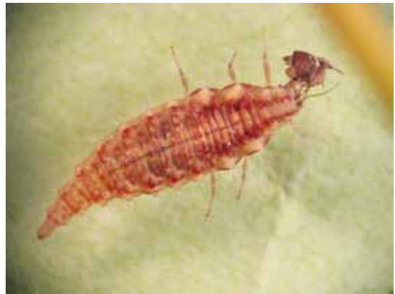
Slika 13. Larvu C. pyri jede larva Chrysopa sp.

kao predator C. mali (Berim, 2005). U Srbiji je bila poznata kao predator biljnih vaši (Vuković, 1986), a ovom prilikom je prvi put utvrđena kao predator C. pyri .