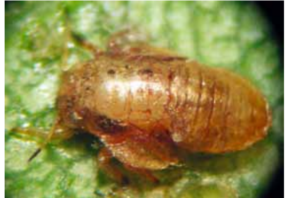
Slika 3. Parazitirana larva (mumija) Cacopsylla pyri (L.)