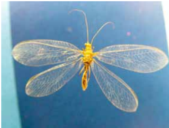
Slika 12. Chrysoperla carnea