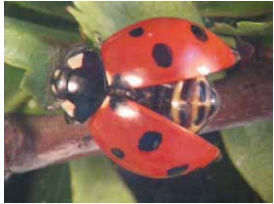
Slika 14. Coccinella septempunctata Linnaeus

Prema literaturnim podacima, na području Francuske Herard (1986) je P. quatuordecimpunctata utvrdio u svim ispitivanim zasadima kruške u niskoj brojnosti. U Turskoj, Erler (2004) registruje P. quatuordecimpunctata i u tretiranim i u netretiranim zasadima kruške tokom prve istraživačke godine, dok je u drugoj godini bila prisutna samo u netretiranom zasadu. Na području Vojvodine, Grbić i sar. (1989a) su P. quatuordecimpunctata utvrdili kao predatora C. pyri .