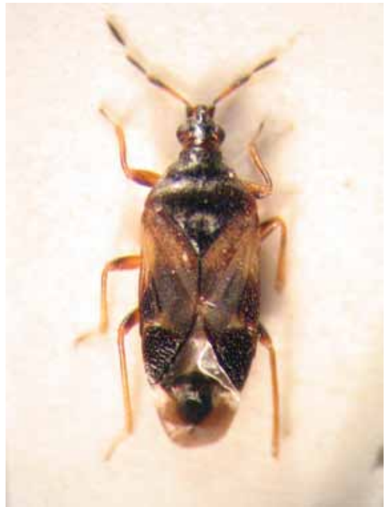
Slika 8. Anthocoris nemorum (Linnaeus)

Prema literaturnim podacima C. verbasci je do sada utvrđena kao predator biljnih vaši, kruškinih buva i grinja u zasadima jabuke i kruške (Protić, 1993; Hagen i sar., 1999; Bradley, 2007). Međutim, u nedostatku plena može da se hrani na samim plodovima jabuke, ređe kruške, narušavajući njihov estetski izgled