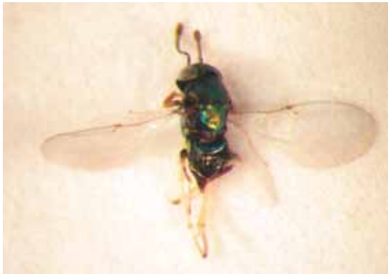
Slika 4. Prionomitus mitratus (Dalm.)

Syrphophagus ariantes (fam. Encyrtidae) smo odgajili iz mumija C. pyri sakupljenih 25. maja 2007. godine (Tabela 2) iz ekstenzivnog zasada kruške u lokalitetu Požarevac.