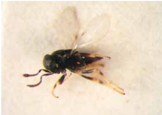
Slika 6. Syrphophagus taeniatus (Förster)

Proučavajući parazitsko-predatorski kompleks C. pyri u zasadu kruške u Francuskoj, Herard (1986) je utvrdio da je A. nemoralis bio najefikasniji predator ove štetoč-