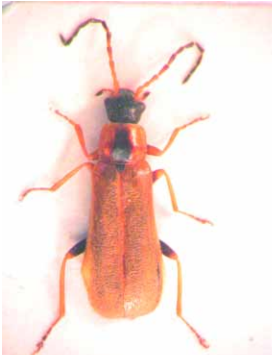
Slika 16. Rhagonycha testacea (Linnaeus)

u Rusiji, a u Italiji kao predator C. pyri (Arzone, 1979, cit. Herard, 1986; Guinchi, 1980, cit. Herard, 1986).