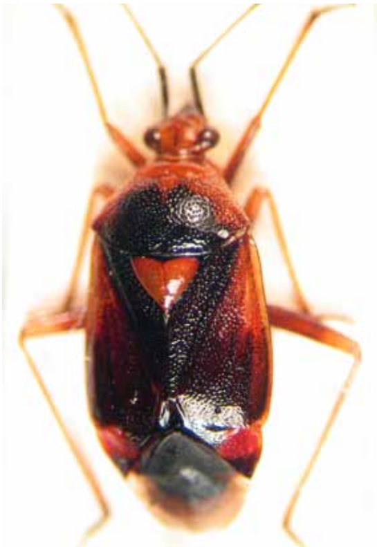
Slika 11. Deraeocoris (Deraeocoris) ruber (Linnaeus)