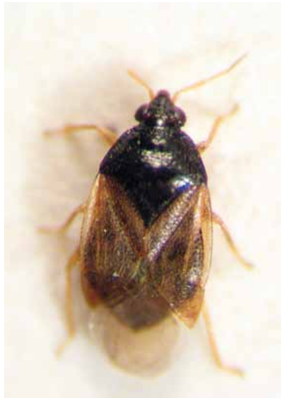
Slika 9. Orius (Heterorius) minutus (Linnaeus)