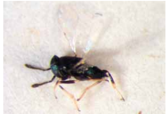
Slika 5. Psyllaephagus procerus Marcet

Forficula auricularia (Dermaptera, Forficulidae) je tokom juna utvrđivana kao predator larvi C. pyri u dva