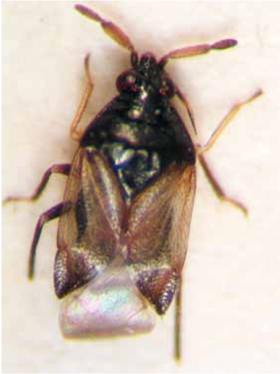
Slika 10. Orius (Heterorius) niger Wolff