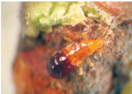
Slika 7. Larva Anthocoris spp. se hrani larvom C. pyri