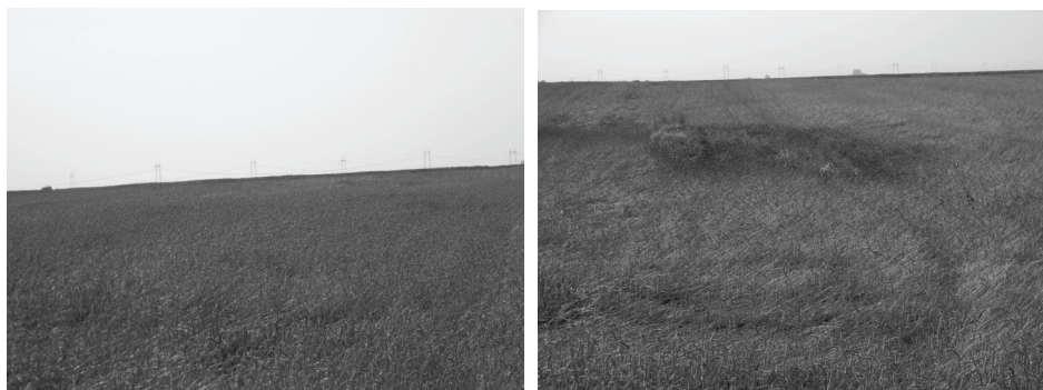
A – kontrolna parcela