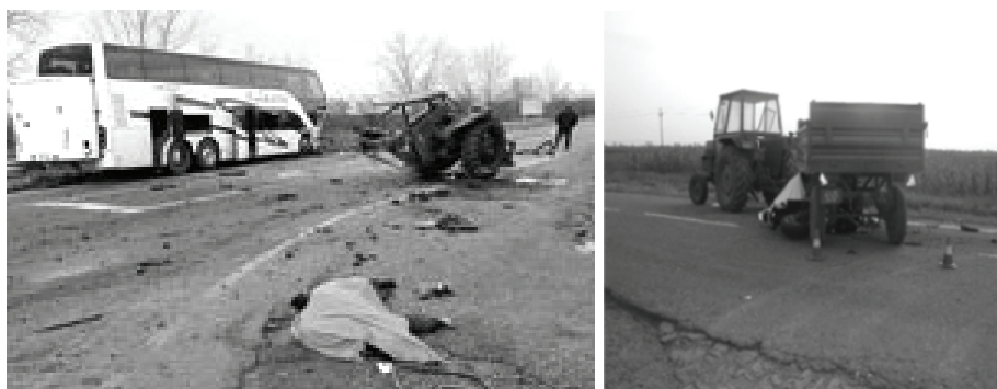
Sl..1. Nesreće sa traktorima i tragične posledice, [35.]

Prema podacima istraživanja [8], [9], [10], u Srbiji, u periodu od 1980. do 1988. godine, je poginulo u različitim nesrećama i mestima (kretanje traktora uz, niz, ili bočni nagib, nepravilna vuča neispravnih traktora, vožnja drugih lica u traktoru na mestima koja nemaju sedište, vožnja neprilagođenom brzinom, prevrtanja, i slično), gde je traktor učestvovao kao vučno-energetska jedinica, preko 900 traktorista, ili prosečno 112 godišnje. U direktnim nezgodama u javnom saobraćaju na teritoriji Srbije (bez pokrajina) od 1990 do 2000 godine, tragično je godišnje nastradalo u proseku 76 vozača traktora.