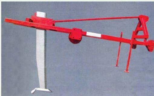
Sl. 3. Vibracioni razrivač VR 5/7 Pic. 3. Vibratory subsoiler VR 5/7

Zaštita bilja je vršena prema postavljenom planu zaštite, primenom dva sistema tretmana herbicidima: