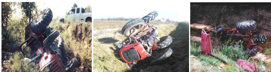
Sl. 1. Tragične posledice pri prevrtanju traktora

Upoređujući rezultate istraživanja (Tab. 6 i 7) može se konstatovati, da pri radu sa traktorom u poljoprivrednim uslovima, najčešći uzrok nesreća je nepažnja pri upravljanju traktorom. Rezultat nepažnje, najčešće je nesreća sa različitim tipovima prevrtanja traktora (Sl. 1.). Poznato je da je prosečna starost traktora u Republici Makedoniji 26 godina [20], i da stariji traktori nemaju ugrađene kabine ili zaštitne ramove, a ni druge sigurnosne elektronske uređaje, koji kontrolišu položaj traktora na nagibu. U takvoj situaciji, teške povrede, pa i smrtne posledice, povređivanje rukovaoca ili putnika na traktoru (koje se voze najčešće na braniku ili stoje na zadnjem delu traktora, bez mogućnosti zaštite) su neizbežne.