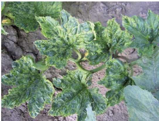
Slika 1. Mešana infekcija ZYMV, WMV i CMV: izraženi mozaik i naboranost lišća

U toku 2007. godine, procenjena zaraženost pregledanih useva kretala se od 30 do 50%, dok je procenjeni nivo učestalosti zaraze virusima 2008. godine bio znatno viši, preko 80%, a u pojedinim usevima sve biljke su ispoljile virusne simptome. Tokom pregleda u obe godine ispitivanja zabeležena je pojava niza simptoma koji su upućivali na virusnu zarazu. Tokom 2007. godine uočeni su simptomi u vidu blagog mozaika i hlorotičnog šarenila, izraženog mozaika i naboranosti (Slika 1),