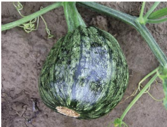
Slika 2. ZYMV: bradavičavost ploda

kao i različite deformacije liske. Razvijeni plodovi zaraženih biljaka bili su deformisani, često sa karakterističnim bradavičastim izraštajima na površini (Slika 2). Simptomi uočeni u toku 2008. godine bili su takođe raznovrsni – od blagog mozaika, hloroze i šarenila lista do izraženog žutozelenog mozaika, izobličavanja lista, duboke nazubljenosti (Slika 3), sve do potpune redukcije lisne površine, odnosno nitavosti. Na stablu pojedinih vreža često je uočavano hlorotično prošaravanje (Slika 4). Pojedine biljke ispoljile su virusne simptome samo na određenim delovima vreža ili samo na mlađem lišću. Kao česta pojava uočeno je žutilo i sušenje starijeg lišća. Usled očigledne rane zaraze biljke su bile zakržljale, bez zametnutih plodova ili sa intenzivnim simptomima na plodu u vidu izraženih deformacija (Slika 4) ili nekroze tek formiranih plodova.