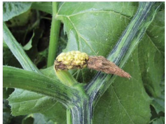
Slika 4. Mešana infekcija ZYMV i CMV: izražena kvrgavost i veoma deformisan mladi plod i šarenilo stabla