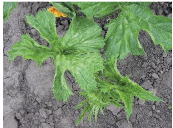
Slika 3. ZYMV: mozaik, nazubljenost i smanjena površina lišća

kao i različite deformacije liske. Razvijeni plodovi zaraženih biljaka bili su deformisani, često sa karakterističnim bradavičastim izraštajima na površini (Slika 2). Simptomi uočeni u toku 2008. godine bili su takođe raznovrsni – od blagog mozaika, hloroze i šarenila lista do izraženog žutozelenog mozaika, izobličavanja lista, duboke nazubljenosti (Slika 3), sve do potpune redukcije lisne površine, odnosno nitavosti. Na stablu pojedinih vreža često je uočavano hlorotično prošaravanje (Slika 4). Pojedine biljke ispoljile su virusne simptome samo na određenim delovima vreža ili samo na mlađem lišću. Kao česta pojava uočeno je žutilo i sušenje starijeg lišća. Usled očigledne rane zaraze biljke su bile zakržljale, bez zametnutih plodova ili sa intenzivnim simptomima na plodu u vidu izraženih deformacija (Slika 4) ili nekroze tek formiranih plodova.