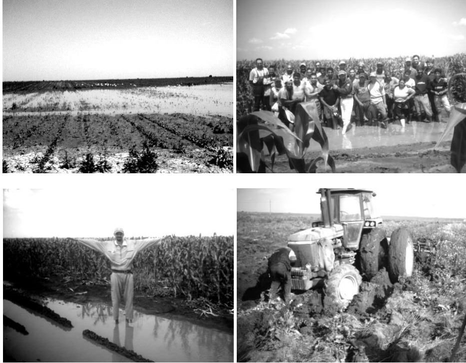
Sl. 4. Izgled površine prevlaženog zemljišta teškog mehaničkog sastava, O.D. Krnješevci [52].