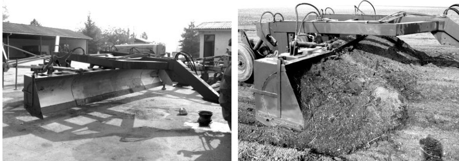
Sl. 1. Univerzalni skreperski ravnjač USM-5

2. Drenažni plug DP-4. Primena ove mašine rešava tehnički problem odvođenja viška vode iz pojedinih horizonata zemljišta teškog mehaničkog sastava i povezivanje sa stalnom drenažom ili kanalima za odvod vode. Pomoću ove mašine omogućena je izrada podzemnih kanala-drenova, njihovo povezivanje sa površinskim horizontom i sa filtracionom zonom cevne drenaže. Višak površinske vode prolazi kroz razriven sloj do kanala, koji vode do otvorenih kanala. U nedostatku vode u oraničnom sloju (sušni period) omogućeno je kretanje vode ka korenovom sistemu biljaka iz donjih slojeva zemljišta. Radni organ (alat) za izvođenje podzemnih profilisanih kanala postavljen je na dugačkoj gredi, što omogućava kvalitetan početak izrade podzemnih kanala od kose ivice otvorenih kanala (Sl. 2).