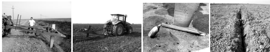
(b) Drenažni plug DP-4