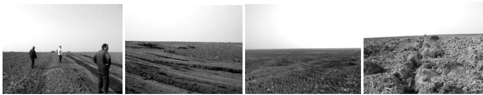
(d) Izgled površine zemljišta pre i posle završetka rada mašina