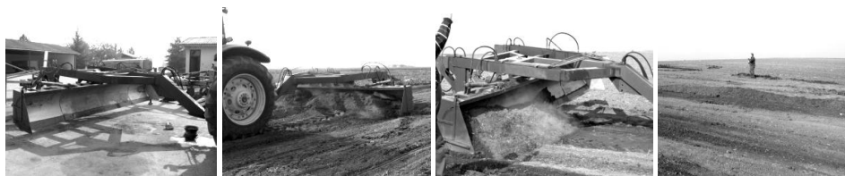
(a) Univerzalni skreperski ravnjač USM-5

Faze rada mašina na O.P. Krnješevci, T-XVII, oktobar 2008.