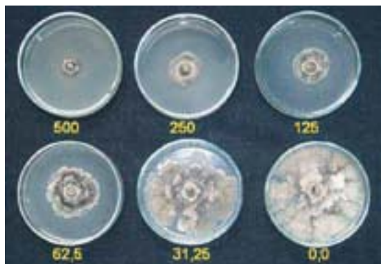
Sl. 1. Rast micelije osetljivog izolata iz Čortanovaca, na podlozi sa benomilom ( \mu\text{g a.m./kg} )