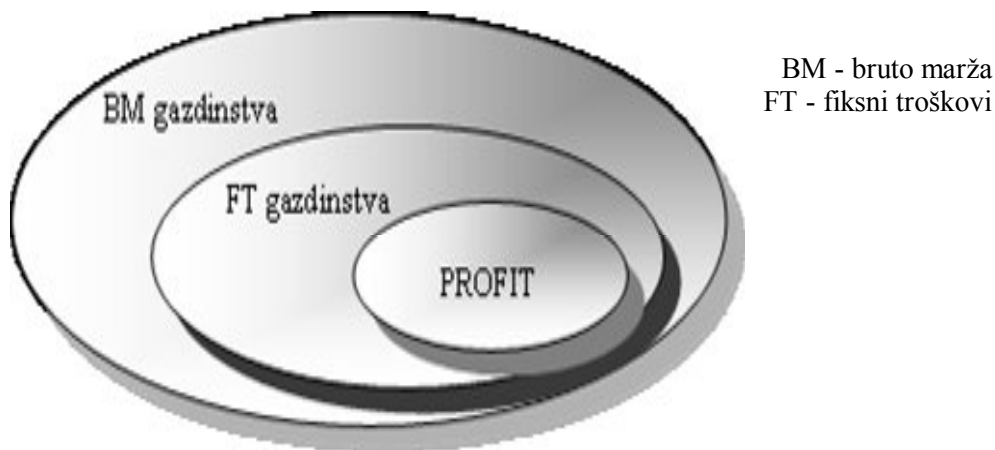
Slika 1. Obraĉun profita na nivou poljoprivrednog gazdinstva

Prema Gogiću (2005) , fiksni troškovi se ne menjaju sa promenom nivoa proizvodnje ili stepena iskorišćavanja kapaciteta, tj. njihov ukupan iznos ostaje isti bez obzira na koliĉinu proizvedenih proizvoda ili izvršenih usluga. U tabeli 1. dat je pregled fiksnih troškova poljoprivrednih gazdinstava.