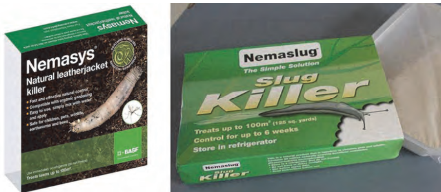
Slika 1. Neke vrste nematoda se već uveliko proizvode i primenjuju kao komercijalni biopreparati za suzbijanje štetnih zemljišnih insekata i puževa golača.

Proizvodnja i primena EPN biopreparata ima već višedecenijsku tradiciju u svetu, najviše u SAD i razvijenim zemljama Evrope, i proizvođači je sve više prihvataju. Posebno je interesantna ova opcija za organsku proizvodnju povrća. U Srbiji se i u ovom segmentu zaštite povrća relativno kasni u praksi.