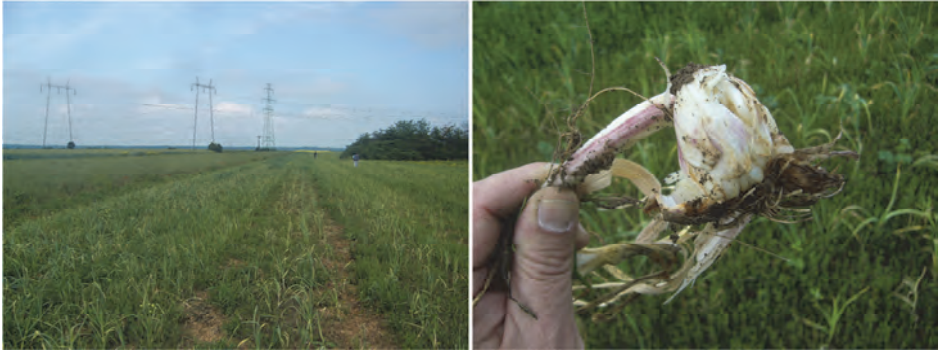
Sl. 3. Šteta na belom luku, prouzrokovana od stabljikine nematode, Ditylenchus dipsaci . A - Parcela od 1 ha sa potpunim propadanjem useva, zasađenog nesertifikovanim zaraženim lukovicama. B - Karakteristične deformacije lukovice belog luka jako zaraženog stabljikinom nematodom.

upravo u kontekstu štetnosti na krompiru (Radivojević, 2015). Uz dosta sličnosti, ove dve vrste se razlikuju u nekim aspektima životnog ciklusa, patogenosti i simptoma. Inače su obe vrste polifagne, ali sa određenim razlikama u spektru biljaka domaćina, kao i po tome na kojim su biljkama u praksi najštetnije. Kao što joj i ime sugerise, SN krompira je ekonomski najštetnija baš na krompiru, ali još nema izveštaja o takvim štetama u Srbiji. Ovo je fakultativno micetofagna vrsta, koja se, prema tome, može održavati u prirodi i bez biljaka domaćina.