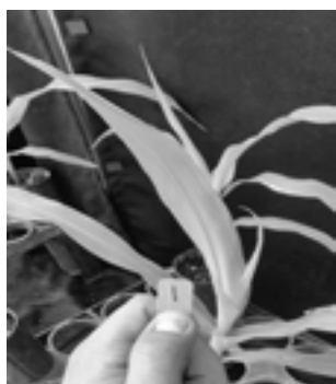
Slika 1. Pojava žute boje na samoniklom kukuruзу 7 DNT kletodimom+COC pri utrošku radne tečnosti od 66 \text{ l ha}^{-1} primenjene XR rasprskivačem

sa adjuvantima i pri manjoj zapremini radne tečnosti ( 66 \text{ l ha}^{-1} ). Takođe i tip rasprskivača, naročito pri manjoj zapremini radne tečnosti, je imao uticaja na stepen oštećenosti samoniklog kukuruza. U trećoj oceni, tj. 21 DNT konstatovan je potpuni prestanak rasta biljaka a ljubičasta boja na listovima je postepeno prelazila u tamnobraon i biljke su postepeno venule i sušile se (Slika 3). Veliki broj biljaka u ovoj fazi je bio polomljen usled propadanja tkiva pri osnovi izdanka. Za razliku od prethodne ocene, vizuelna oštećenja 28 DNT su bila gotovo izjednačena u svim tretmanima. Takođe, i u poslednjoj oceni nije bilo razlika između tretmana u stepenu oštećenosti samoniklog kukuruza tj. došlo je do potpunog sušenja biljaka (Slika 4) osim kontrolnih.