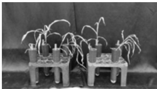
Slika 3. Simptomi oštećenja na samoniklom kukuruзу 21 DNT kletodim+NIS pri utrošku radne tečnosti od 66 \text{ l ha}^{-1} primenjene TTI rasprskivačem

Figure 2. Differences in the level of injury of volunteer corn 14 DAT by clethodim, at a consumption rate of 66 \text{ l ha}^{-1} (left) and 132 \text{ l ha}^{-1} (right) of carrier volume, applied with a TTI spray nozzle