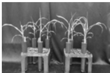
Slika 2. Razlika u intenzitetu oštećenja kod samoniklog kukuruзу 14 DNT kletodimom pri utrošku radne tečnosti od 66 \text{ l ha}^{-1} (levo) i 132 \text{ l ha}^{-1} (desno) primenjene sa TTI rasprskivačem

Figure 2. Differences in the level of injury of volunteer corn 14 DAT by clethodim, at a consumption rate of 66 \text{ l ha}^{-1} (left) and 132 \text{ l ha}^{-1} (right) of carrier volume, applied with a TTI spray nozzle