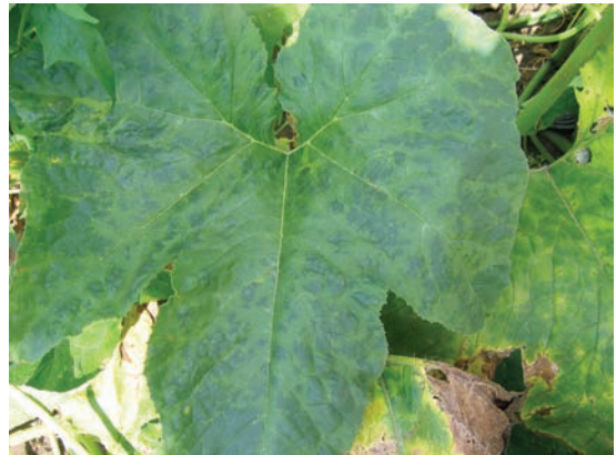
Slika 3. Izolat 146-08: prošaravanje lišća i zadržavanje zelene boje oko nerava