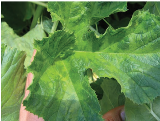
Slika 2. Izolat 140-08: izražena hloroza i zadržavanje zelene boje oko nerava