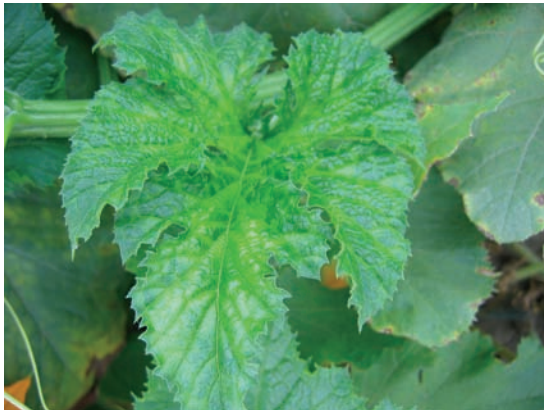
Slika 1. Izolat 128-08: izražena hloroza, žutilo oko nerava i naboranost liske

Prema ispoljenim simptomima, koje su izazvali na uljanoj tikvi sorte Olinka (Slike 1-4) u polju, izolati