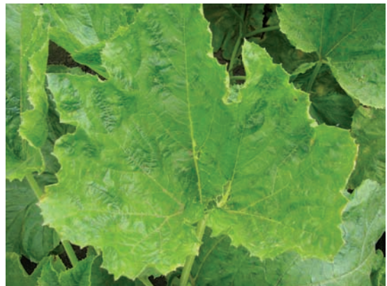
Slika 4. Izolat 147-08: izražena hloroza, zadržavanje zelene boje i naboranost oko nerava