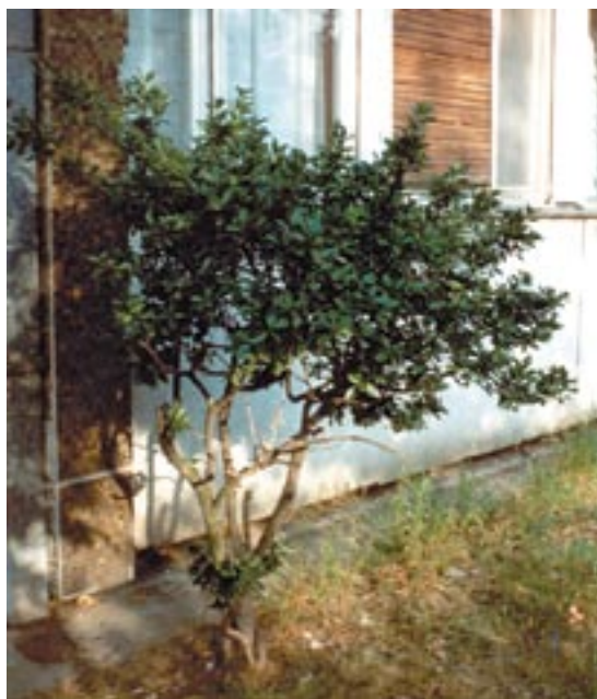
Slika 7b. Zdrava biljka Euonymus japonica Figure 7b. Healthy Euonymus japonica plant