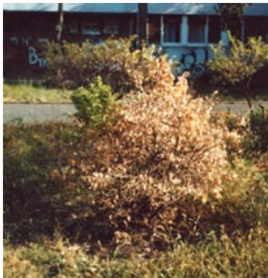
Slika 7a. Napadnuta i osušena biljka Euonymus japonica Figure 7a. Infested and dried Euonymus japonica plant

Na biljkama Euonymus fortunei u privatnim baštama, dvorištima i žardinjerama na Novom Beogradu, intenzitet napada ocenjen ocenama 2 i 3, prouzrokovao je sušenje pojedinačnih grana.