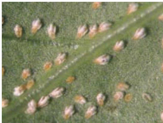
Slika 4. Larve drugog stupnja budućih mužjaka Figure 4. Second instar male

Tokom dvogodišnjeg praćenja životnog ciklusa, utvrđeno je da kurikin štitaš ima tri generacije godišnje i da