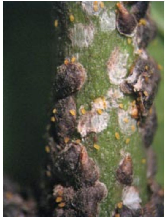
Slika 1. Larve prvog stupnja „lualice” Figure 1. First instar „crawlers”

Ženka je kruškolikog tela, dužine 1.2-1.4 mm, bez pipaka, krila i nogu, žute ili narandžasto žute boje. Poslednja četiri segmenta trbuha su srasla i obrazuju pigidijum koji je karakteristične građe i koristi se za determinaciju vrste.