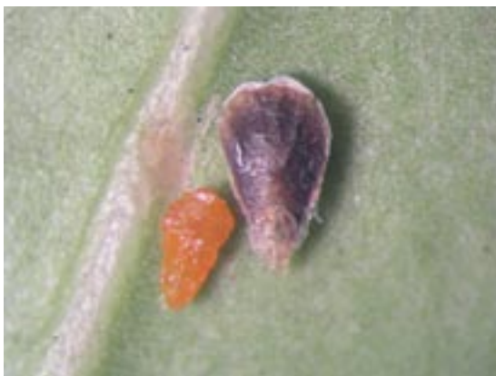
Slika 3. Izgled ženke i štita U. euonymi Figure 3. Female and scale cover of U. euonymi

Štit ženke je kruškolik ili široko kruškolik, blago konveksan, 1.8-2.2 mm dug, tamno smeđe boje. U sastav štita ulaze dve larvene košuljice smeđe boje (Slika 3).