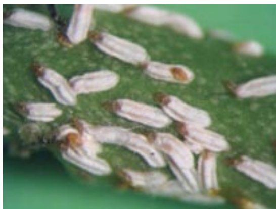
Slika 5. Štitovi mužjaka U. euonymi Figure 5. Male scale covers of U. euonymi

prezimljava u stadijumu polno zrelih ženki na stablu i granama kurike. Početak ovipozicije prezimljućih ženki registrovan je 13, odnosno 15. maja (Tabela 1). Period polaganja jaja je veoma razvučen i traje oko tri nedelje. Ženka u proseku položi 40-50 jaja. Položena jaja nalaze se ispod štita ženke i izolovana su od podloge belom voštanom opnom koja ima i zaštitnu ulogu.