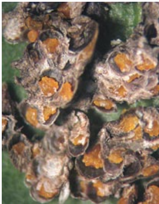
Slika 6. Kolonije U. euonymi Figure 6. Colonies of U. euonymi

njen ocenom 4 (Slika 6). Drvenaste delove biljke su naseljavale i ženke i mužjaci, pri čemu su ženke bile brojnije na mladim i sočnijim granama. Listove naseljavaju uglavnom larve mužjaka, mada su pri jakom napadu zabeležene i larve ženki i ženke.